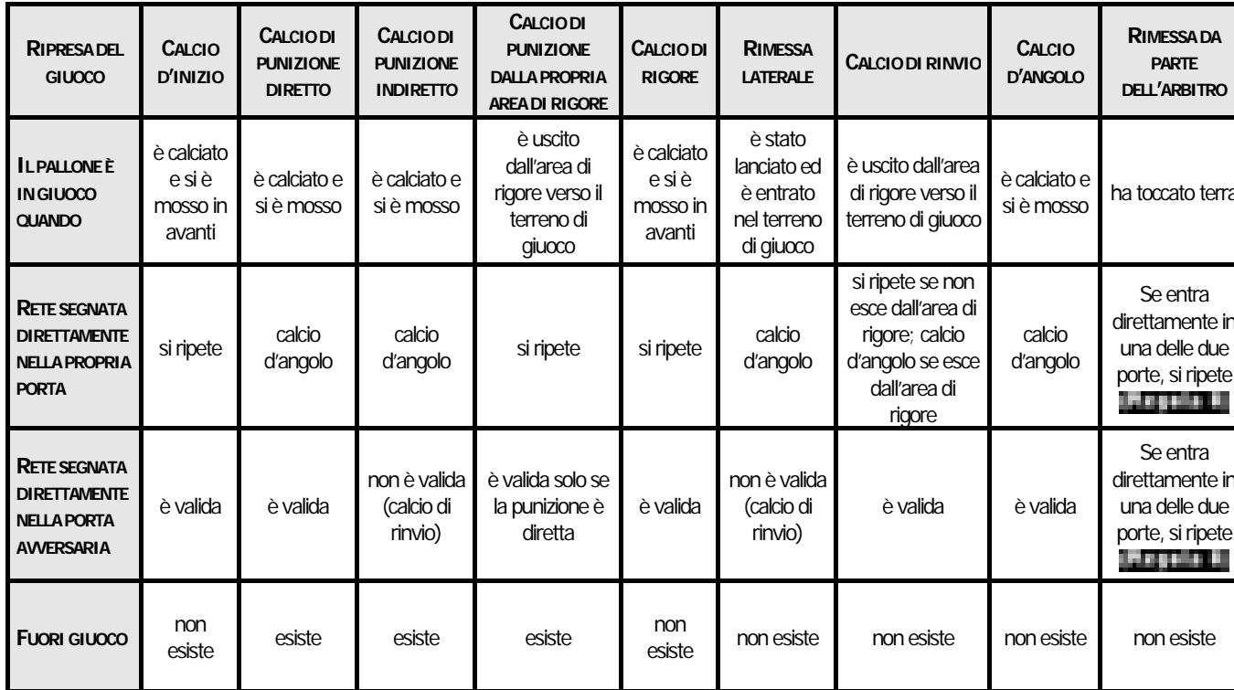
TABELLA DELLE DIVERSE RIPRESE DEL GIUOCO